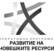
Таблица № П1